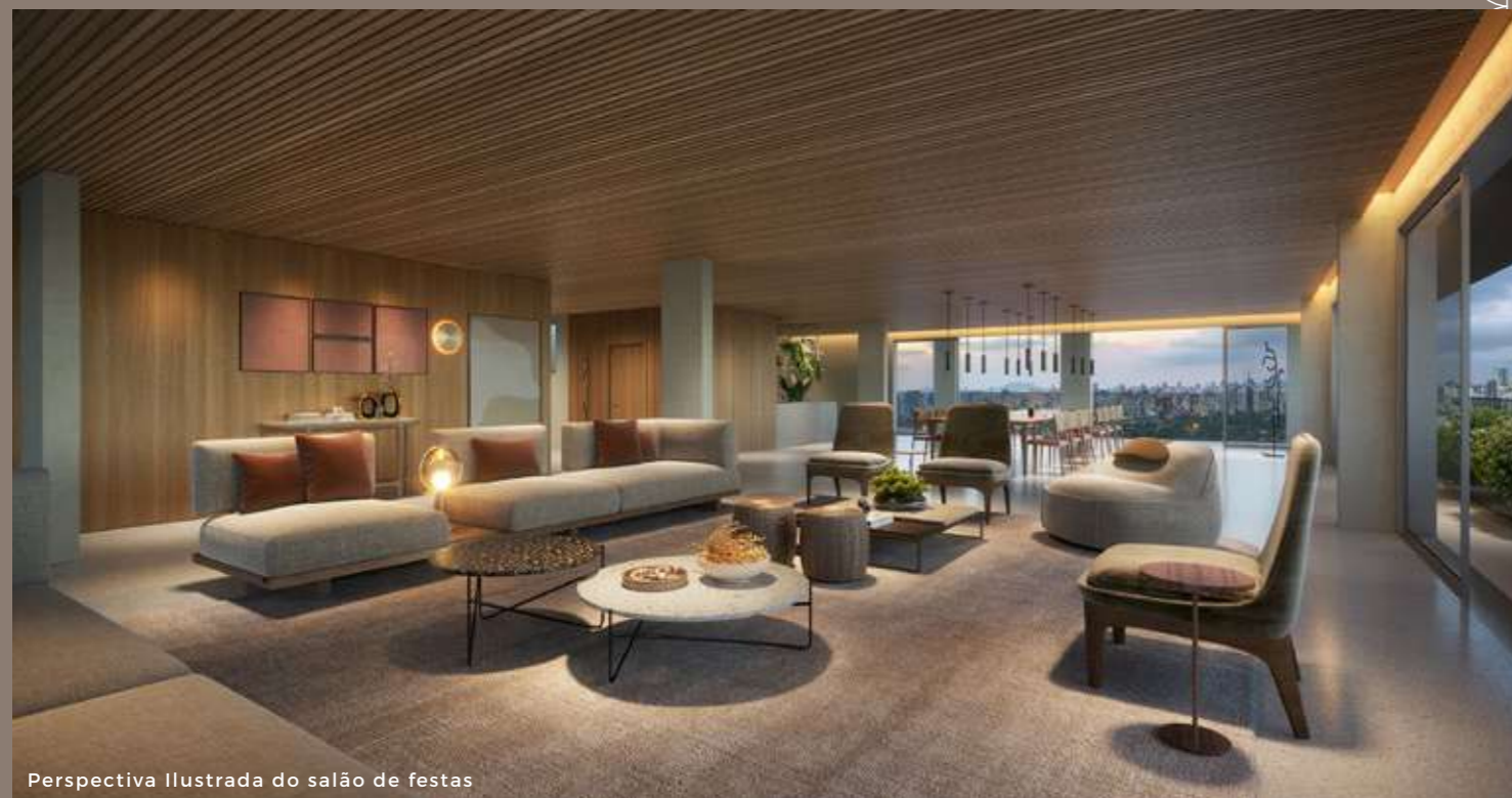
Perspectiva Ilustrada do salão de festas