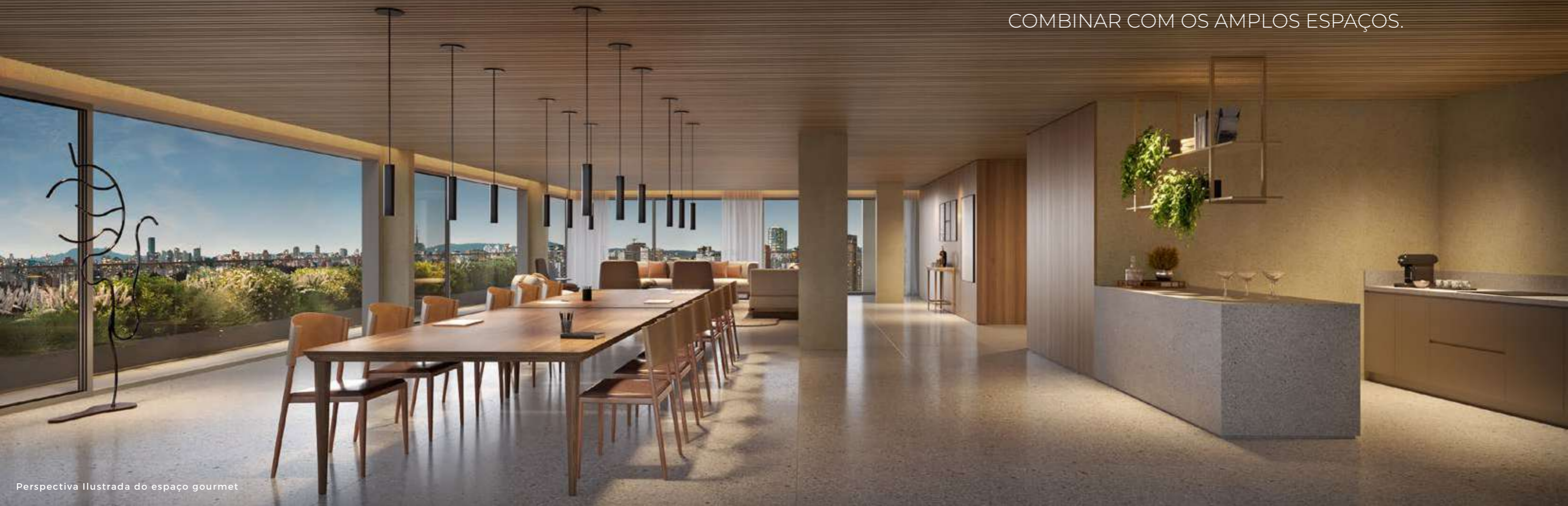
Perspectiva Ilustrada do espaço gourmet

A VISTA PANORÂMICA CHEGA PARA COMBINAR COM OS AMPLOS ESPAÇOS.