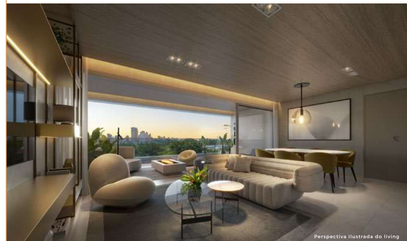
Perspectiva Ilustrada do living

OS MOVÉIS E UTENSÍLIOS NÃO FAZEM PARTE DO CONTRATO. OS REVESTIMENTOS, BANCADAS, LOUÇAS E METAIS SÃO SUGESTÃO DE DECORAÇÃO. OS MESMOS SERÃO ENTREGUES CONFORME O MEMORIAL DESCRITIVO DO EMPREENDIMENTO. MEDIDAS DE FACE A FACE DE PAREDES SUJEITO A VARIACÃO EM DECORRÊNCIA DA EXECUÇÃO E DOS ACABAMENTOS A SEREM UTILIZADOS.