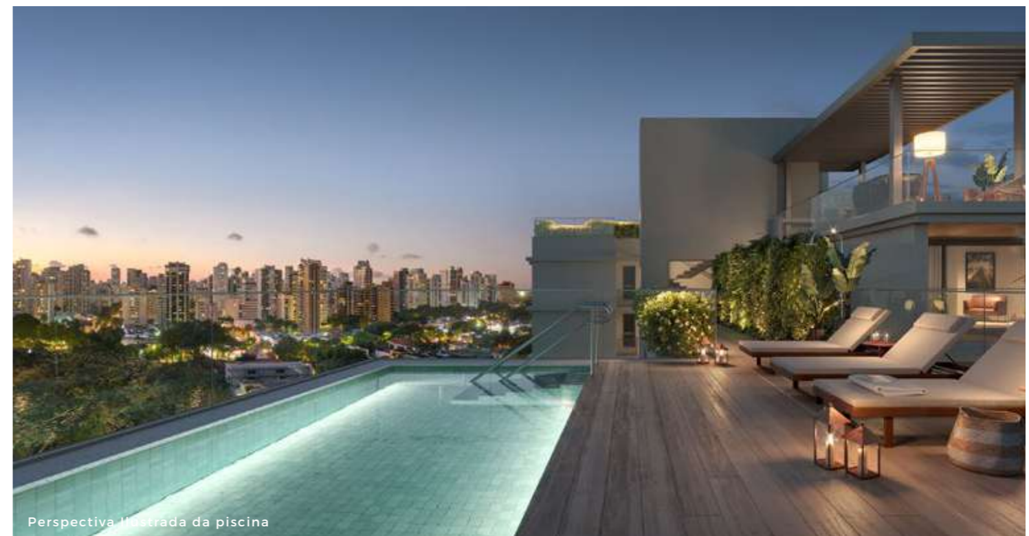
Perspectiva Ilustrada da piscina