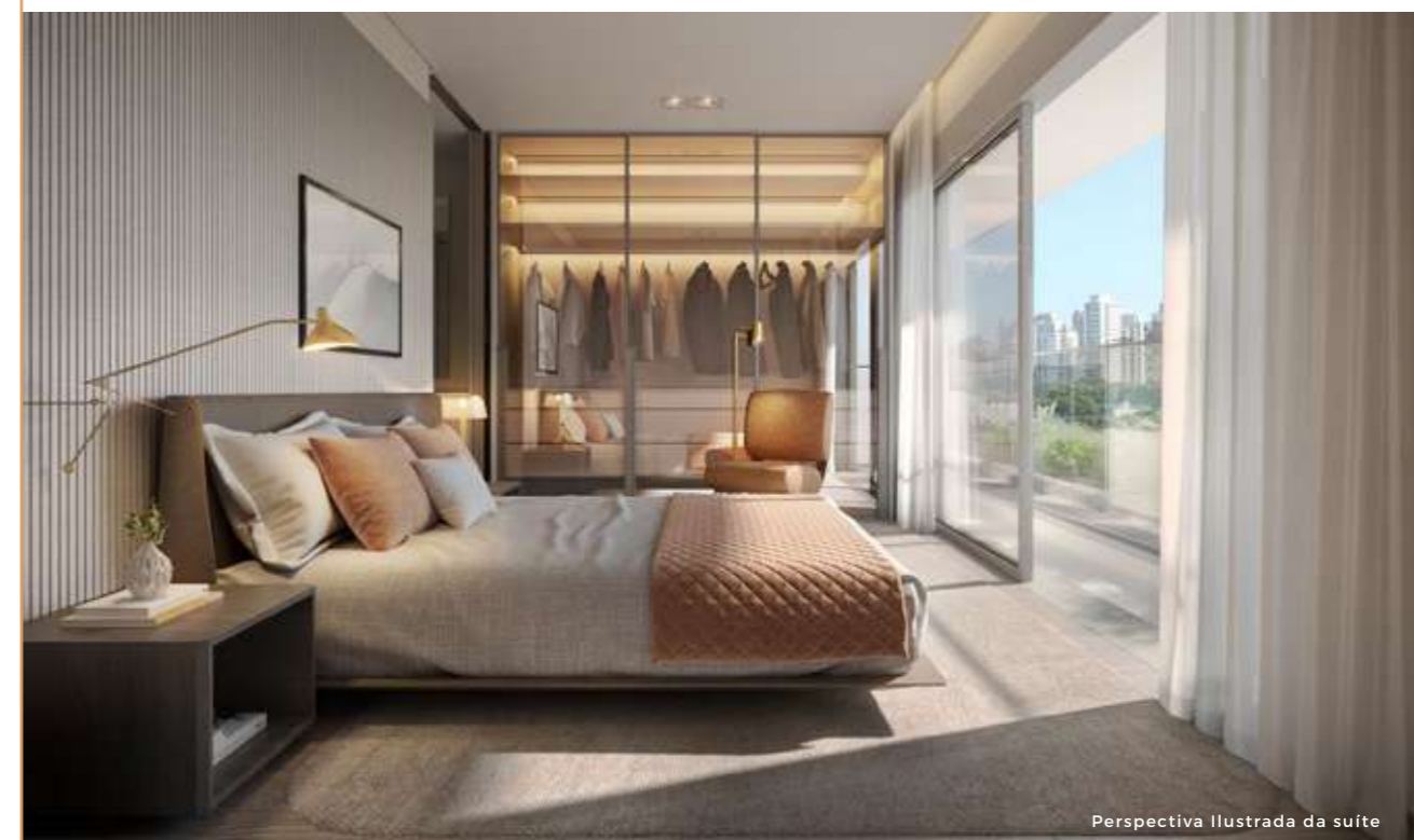
Perspectiva Ilustrada da suíte

OS MOVÉIS E UTENSÍLIOS NÃO FAZEM PARTE DO CONTRATO. OS REVESTIMENTOS, BANCADAS, LOUÇAS E METAIS SÃO SUGESTÃO DE DECORAÇÃO. OS MESMOS SERÃO ENTREGUES CONFORME O MEMORIAL DESCRITIVO DO EMPREENDIMENTO. MEDIDAS DE FACE A FACE DE PAREDES SUJEITO A VARIACÃO EM DECORREÊNCIA DA EXECUÇÃO E DOS ACABAMENTOS A SEREM UTILIZADOS.